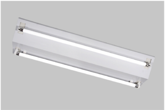
LH001402M 14W X 2 山型