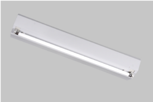
LH001401M 14W X 1 山型